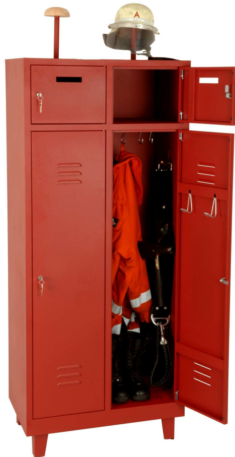
Einsatzschrank mit Fuß-Set, Wertfach und Flügeltüren