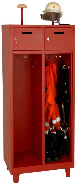
Einsatzschrank mit Fuß-Set und Wertfach

Dabei sind die Feuerwehrschränke basic flexibel in der Ausstattung. Mit oder ohne Füße, mit Wertfach oder mit Schranktür. Viele Details sind nachrüstbar. Die Feuerwehrschränke basic haben eine Abteibreite von 400 mm und sind in der Ausführung als 1, 2 oder 3 Abteile lieferbar. Schränke mit der Abteibreite 500 mm auf Anfrage.